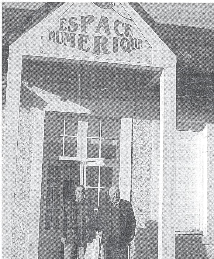
L'espace numérique est ouvert à tous le mercredi et le samedi.

Renseignements et inscriptions en mairie de Gournay au 02.54.30.84.11.