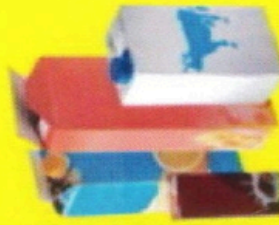
Briques / Bricks