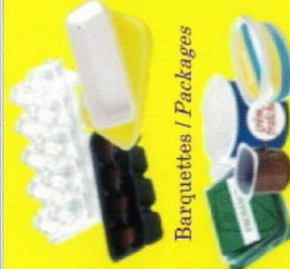
Barquettes / Packages