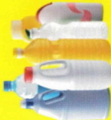
Bouteilles / Bottles