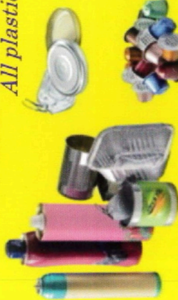
Aérosols / Spray cans