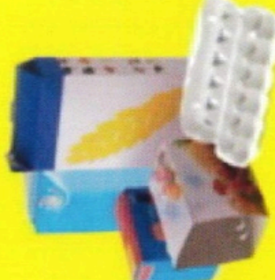
Cartons / Cardboards